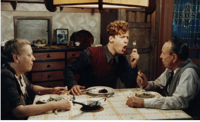
Scène uit de verfilming van De Avonden

hem vroeg: ‘Vader smaakt het?’, als grootste compliment kon geven: ‘Het komt wel op.’ Hij had er nog minder woorden voor over dan de vader van Frits, en hij deed er verder nors kijkend het zwijgen toe. Wij aten altijd VGA (vlees, groenten, aardappelen), maar een enkele keer wanneer het op een zondag slecht en regenachtig weer was, kookte mijn vader macaroni met smac (een vies vleesproduct uit blik). Mijn moeder is dat soort VGA-eten blijven maken tot aan haar dood. Ik hield ervan, maar gevarieerd was het niet.