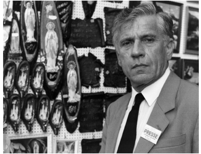
Gerard Reve (1923-2006)