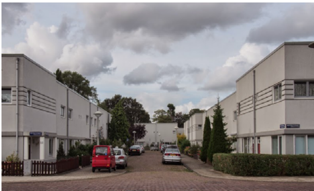
Betondorp in Amsterdam

Ik ben opgegroeid in de Watersgraafsmeer, dat aan Betondorp grenst. De Nieuwe Ooster, een begraafplaats, ligt ertussenin. Ik ben geboren in 1952 en veel jonger dan Gerard Reve, maar