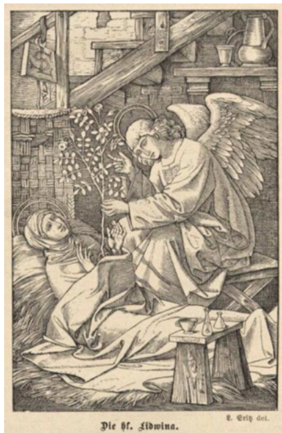
Drieëndertig jaar bleef Liedewij in bed liggen

onvergankelijke kennis. Als het lichaam een stoorzender is van de zuivere geest, doet een mens er goed aan om de opdringerige behoeften ervan uit te schakelen. En naarmate de noden van het lichaam zich krachtiger opdringen, in de vorm van bijvoorbeeld stekende pijn of schreeuwende honger, is de prestatie om die storende signalen weg te drukken des te indrukwekkender.