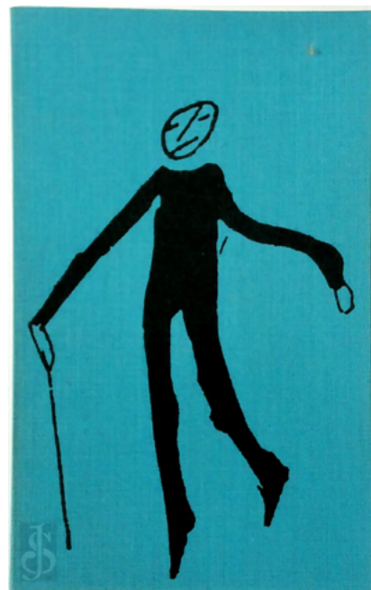
Franz Kafka - Een hongerkunstenaar en andere verhalen

Om die reden was hij ook zo ongelukkig wanneer hij onder luide toejuichingen na veertig dagen uit zijn kooi werd bevrijd. Begon hij net lekker erin te komen, moest hij er al weer uit; juist op het moment dat hij in zijn goede hongervorm begon te komen. Hij zou het namelijk nog heel