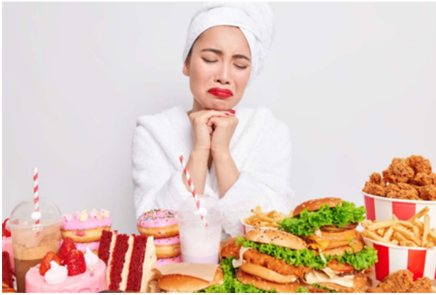
Een vreetbui is iets anders dan gewoon te veel eten

Omdat ze zich te zeer schaamt om al het eten in één winkel te kopen, gaat ze meestal naar een tweede en zelfs een derde supermarkt: