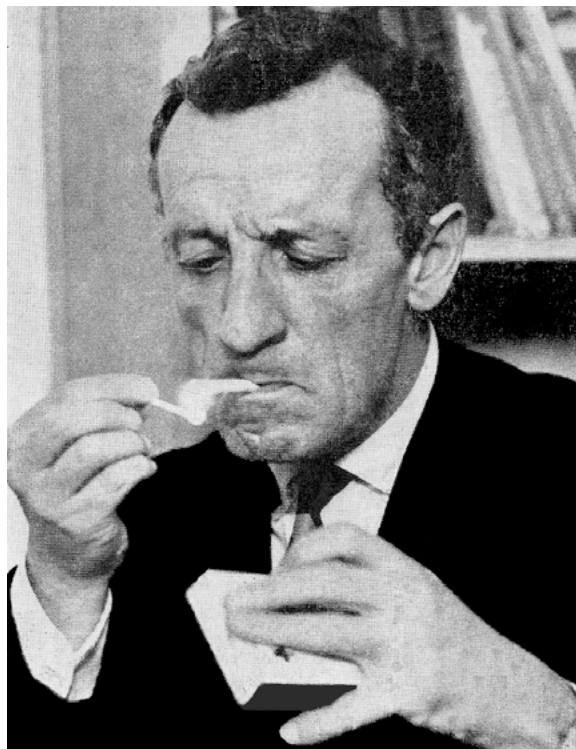
Maurice Merleau-Ponty (1908-1961)

Problemen met deze 'belichaming' zijn in Weerlicht ook uitgedrukt in fragmenten waarin de ik een 'wel willen, maar niet kunnen' beschrijft, of een ' weten wat goed is', zonder dat vanzelfsprekend in actie te kunnen omzetten: 'Ik durf mijn moeder niet aan te kijken. Ik wil het wel, maar ik kan het niet.' Of: 'ik wil haar nog een keer roepen, maar nu doet ook mijn stem het niet meer.'