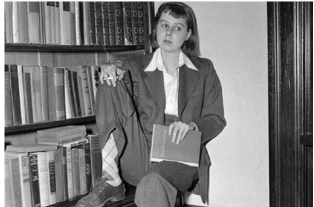
Carson McCullers (1917-1967)

Dat ook kinderen hartenpijn kunnen ervaren, zag ik in een prachtig filmpje uit de serie ‘The Secret Life of 4 Years Old’ waarin een vierjarig meisje bedroefd vertelde over ruzie met een schoolvriendje dat niet met haar wilde spelen waardoor het voelde alsof haar hart verschrompeld was. Interessant genoeg beschrijft de Amerikaanse schrijfster Carson McCullers