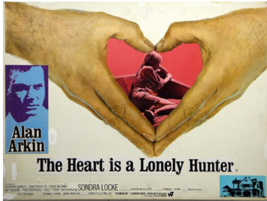
Verfilming van The heart is a lonely Hunter met Alan Arkin en Sondra Locke

kloppend hoofd' komt Singer na de lange reis terug in zijn kamer waar hij zich na even uitgerust te hebben een kogel door het hart schiet.