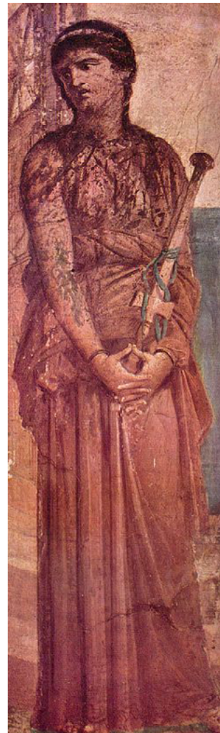
Medea nadat ze haar eigen kinderen heeft gedood

Euripides laat zien dat hij snapt wat een gebroken hart inhoudt en welke gevolgen dit kan hebben in een mensenleven. De emotionele, mentale en fysieke reacties die passen bij een moderne definitie van een gebroken hart zijn allemaal terug te vinden in de tragedie. Medea reageert op sterk fysieke wijze door niet meer te eten en alleen maar te liggen. Ook emotioneel reageert ze behoorlijk heftig: ze heeft een doodswens die uiteindelijk omslaat in wraakplannen op Jason. In Medea van Euripides wordt zo zichtbaar hoe Medea's liefde haar hamartia wordt, en uiteindelijk uitmondt in een tragedie waarin alles om haar heen wordt vernietigd.