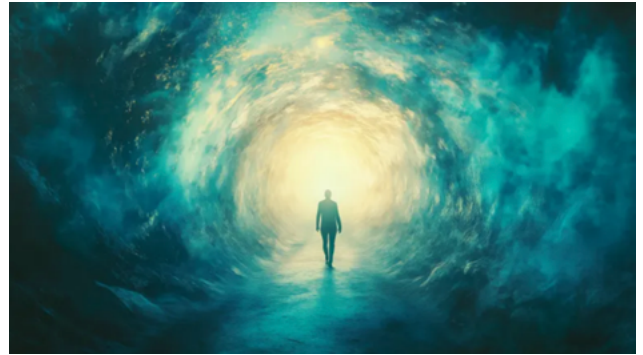
Op weg naar het licht

Maar dat helder schijnende licht daarginds zou hij toch nooit helemaal bereiken. Zijn uit het lichaam opgestegen bewustzijn ziet vanuit een hoger camerastandpunt hoe hij daar op de geblokte vloer van het ziekenhuis ligt, en hoe ijverige handen zijn lichaam bewerken. Ineens hoort hij hoofden lachen. Wat betekende dat hij terug was, vanuit het rijk van de dood weer in dat van het leven. Zijn bewustzijn was daarmee opnieuw onderdeel geworden van het vertrouwde