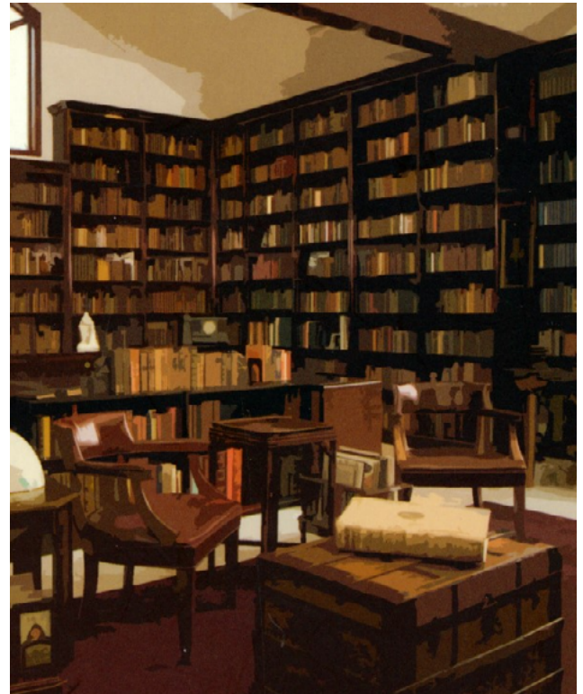
De bibliotheek van Flaubert, te zien in het gemeentehuis van Canteleu, Frankrijk

'Wellicht is de belangrijkste van alle oorzaken die de gezondheid van de vrouwen hebben geschaad, de eindeloze hoeveelheid romans die er de laatste honderd jaar zijn geschreven.' (Pomme, Verhandeling over vapeutlijders van beiderlei kunne , 1769, deel 11, blz. 441)