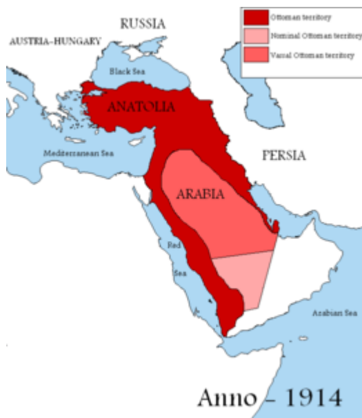
Het Turkse rijk anno 1914

Het verhaal speelt zich af op het fictieve eiland Minger, onderdeel van het Ottomaanse rijk, maar bewoond door moslims en christenen. Het Ottomaanse rijk was toen veel groter dan Turkije nu, maar wel in verval.