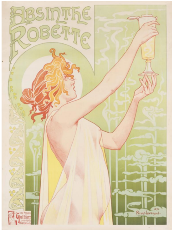
Affiche voor Absinthe robette , 1896, naar een ontwerp van Privat Livemont, kleurenlithografie, particuliere collectie: bron