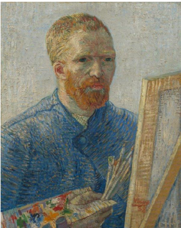
Vincent van Gogh, Zelfportret als schilder , 1887-1888, olieverf op doek, 65.1 x 50 cm, Van Gogh Museum, Amsterdam (Vincent van Gogh Stichting): bron