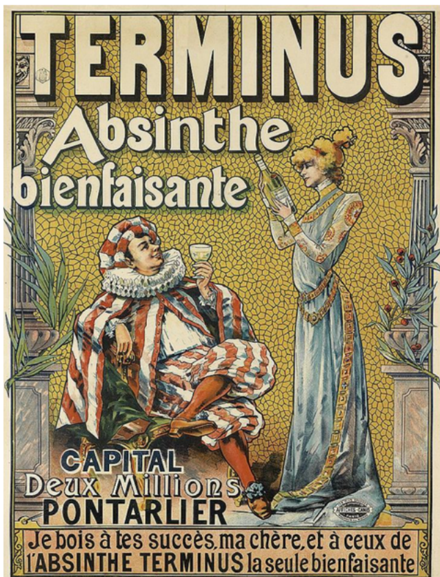
Affiche voor Terminus Absinthe bienfaisante , c. 1897, naar een ontwerp van Francisco Tamagno, kleurenlithografie, particuliere collectie: bron

Ook beroemde personen werden gebruikt om het groene drankje te promoten, zoals in Terminus Absinthe bienfaisante . Iedere negentiende-eeuwse passant die dit affiche op straat zag hangen, herkende de twee acteurs: Benoît-Constant Coquelin, in een vertolking van een zijn theaterpersonages (vermoedelijk Cyrano de Bergerac ), en Sarah Bernhardt. Coquelin heft het glas om te proosten op het succes van Bernhardt, die glimlachend de fles bestudeert. In werkelijkheid hadden beide acteurs niet ingestemd met deze reclame, en Bernhardt klaagde de fabrikant succesvol aan, al duikt het affiche nog altijd op – zo ook hier.