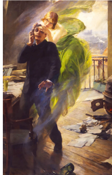
Albert Maignan, La Muse verte , 1895, olieverf op doek, 175 x 115 cm, Musée Picardie, Amiens

In de negentiende eeuw worden absint en andere roes- en genotmiddelen vaak verbeeld door de verleidelijke, gevaarlijke vrouw, zoals in La muse verte . De dichter raakt hier bevangen door zijn groene muze, die zojuist uit een lege fles absint op de vloer is ontsnapt. Uit zijn handgebaar lijkt het alsof hij de fles zojuist op de vloer heeft geworpen, alsof zijn muze hem niet de benodigde inspiratie heeft geboden. Zijn werk ligt klaar om de kachel in te gaan.