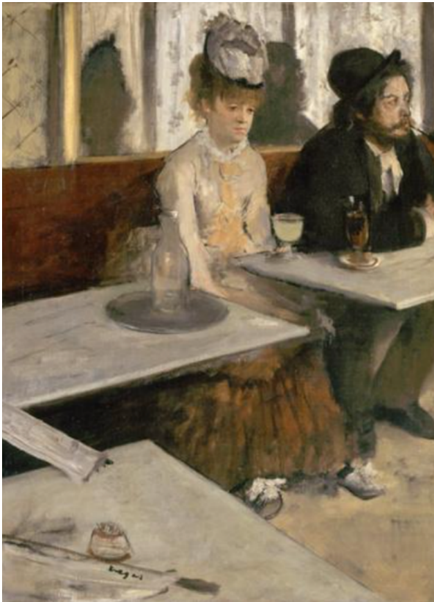
Edgar Degas, Dans un café (L'absinthe), 1875-1876, olieverf op doek, 92 x 68,5 cm, Musée d'Orsay, Parijs: bron

De machthebbers van de Derde Republiek van Frankrijk, ontstaan na de Commune van Parijs in 1871, probeerden de grote sociale onrust die met name binnen de arbeidersklasse heerste, te onderdrukken. Alcohol werd als een van de belangrijke drijfveren achter deze onrust gezien, en zou de oorzaak zijn van veel ziektes. De staat deed daarom haar best te waarschuwen voor de gevaren van alcohol, ditmaal vooral de mannen aansprekend, zoals in het affiche L'Alcool tue waarin een man aan een hevig delier lijdt, terwijl zijn vrouw en drie kinderen enkel kunnen toekijken. In L'Alcool, voilà l'ennemi wordt heel visueel gemaakt wat alcohol met je doet – althans, alcohol op basis van specifieke grondstoffen, want het idee was dat wijn, cider en bier geen kwaad kunnen, maar dat je van absint en cognac en dergelijke snel oud en verlept wordt, dat je organen ernstig worden aangetast en dat deze dranken leiden tot immoreel gedrag.