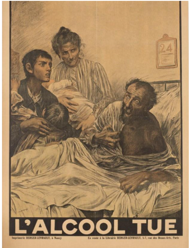
Affiche L'Alcool tue , rond 1900, naar een ontwerp van Eugène Burnand, kleurenlithografie

De machthebbers van de Derde Republiek van Frankrijk, ontstaan na de Commune van Parijs in 1871, probeerden de grote sociale onrust die met name binnen de arbeidersklasse heerste, te onderdrukken. Alcohol werd als een van de belangrijke drijfveren achter deze onrust gezien, en zou de oorzaak zijn van veel ziektes. De staat deed daarom haar best te waarschuwen voor de gevaren van alcohol, ditmaal vooral de mannen aansprekend, zoals in het affiche L'Alcool tue waarin een man aan een hevig delier lijdt, terwijl zijn vrouw en drie kinderen enkel kunnen toekijken. In L'Alcool, voilà l'ennemi wordt heel visueel gemaakt wat alcohol met je doet – althans, alcohol op basis van specifieke grondstoffen, want het idee was dat wijn, cider en bier geen kwaad kunnen, maar dat je van absint en cognac en dergelijke snel oud en verlept wordt, dat je organen ernstig worden aangetast en dat deze dranken leiden tot immoreel gedrag.