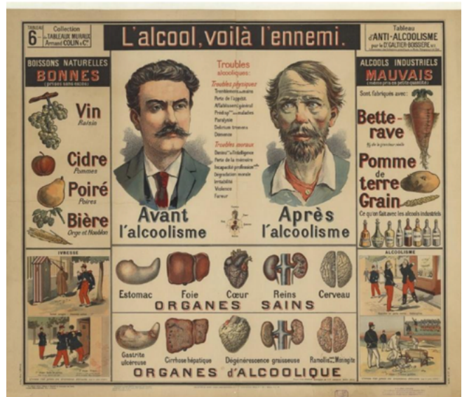
Affiche L'Alcool, voilà l'ennemi ... Tableau d'anti-alcoolisme , van dokter Galtier-Boissière, rond 1900, Bibliothèque Nationale de France, Parijs: bron