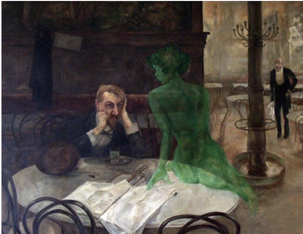
Viktor Oliva, De absintdrinker , 1901, olieverf op doek, Café Slavia, Praag: bron

In een melancholische houding staart een man over zijn glaasje absint de ruimte in. Zich vleidend over zijn tafel verrijst een naakte, vrouwelijke hallucinatie, de groene fee: biedt zij hem de nodige inspiratie om hierna weer aan het werk te gaan? Of symboliseert zij het verleidelijke gevaar en schuift de ober al naar hem toe om hem zijn volgende glas in te schenken, hem enkel naar de verdoemenis helpend? De sombere sfeer in het schilderij doet het laatste vermoeden.