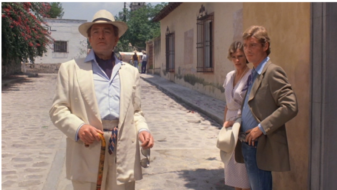
Albert Finney als de Britse consul Geoffrey Firmin in de verfilming van Onder de vulkaan

Het noodlot, daar is het bestaan van de Britse consul van doordrenkt. En het is heel verleidelijk om te denken dat het voor de auteur niet anders is. Onder de vulkaan is immers een autobiografisch boek, in de zin dat het belangrijkste personage verdacht veel lijkt op zijn schepper. Dus ook op